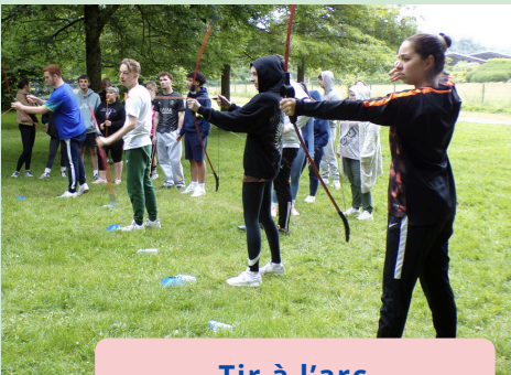
Tir à l'arc