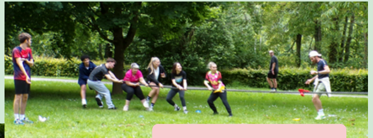
Tir à la corde